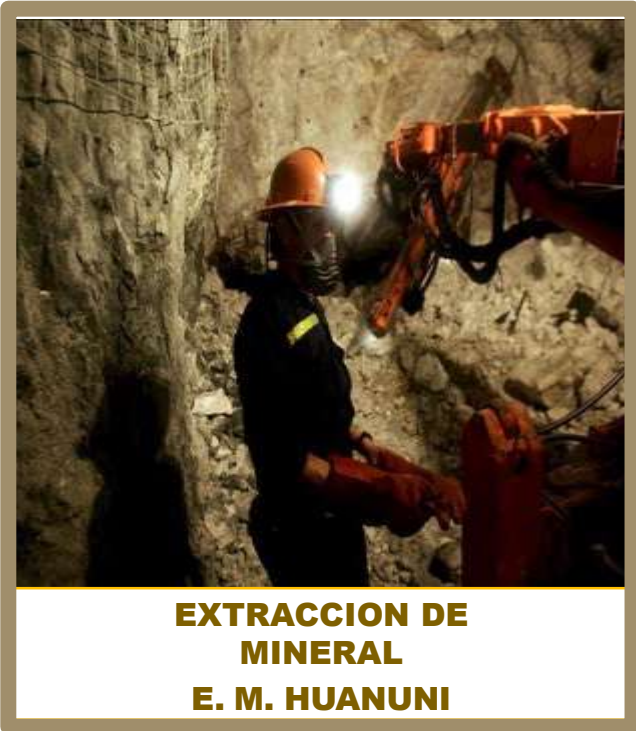
EXTRACCION DE MINERAL E. M. HUANUNI